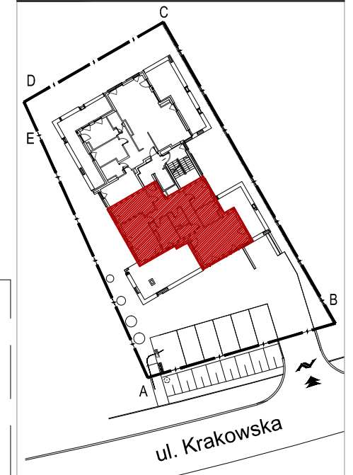
Mieszkanie nr 28